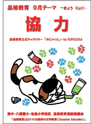
みにやっトポスター9月

の豚汁と一緒に温もるなど、小学校と中学校の連携が進んでいます。ちなみにオスの三毛猫が生まれる確率は3万分の1で、船に乗せると遭難しないという言い伝えもあり、古くから船の守り神だったそうです。「みにやっト」が「みなと」の守り神になりますように！