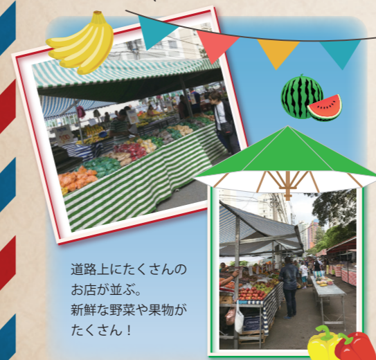
道路にたくさんのお店が並び、新鮮な野菜や果物がたくさん!

港区出身の夫の転勤に伴い、地球の裏側ブラジルのサンパウロへ家族四人で引っ越し。ブラジルでの暮らしで何を感じたか、異文化での生活や子育てなど、ブラジルの日常をお届けします。