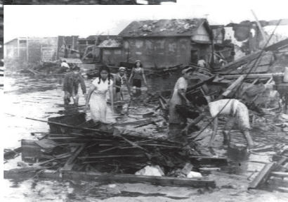
潮の中から衣類を探す罹災者 (港区役所附近)

大阪北部の地震発生から2カ月経ち、記憶が薄れてきた頃ではないでしょうか。「天災は忘れた頃にやってくる」を忘れないようにしたいですね。 津波は大阪市内に甚大な被害をもたらしました。 大津波は大阪市内に甚大な被害をもたらしました。