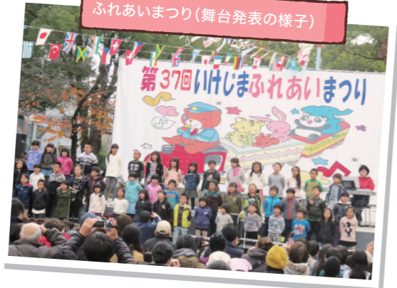
ふれあいまつり(舞台発表の様子)

数多くある港区の地域イベント。その先駆けとなった「池島ふれあいまつり」は、今年の11月23日(祝日)で38回目を迎えます。今では小学校の学習の一環として、子どもたちの文化発表の場でもあり、日々の成果を見てもらいます。この日のために合唱や合奏の練習をして、当日は池島公園に設置される、地域の方々による手作りの屋外ステージで披露します。近所のおじいちゃんおばあちゃんも楽しみに来られ、毎年6,000人以上の来場者で賑わいます。