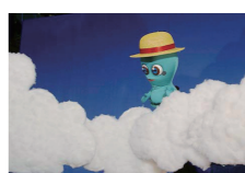
出演:人形劇団京芸

うみぼうずの息子・うみぼうやは遊ぶのが大好き。ある日、入道雲の上に登って降りられなくなってしまうのですが…。うみぼうやを助けるため、父さんのうみぼうずと海の仲間たちが大奮闘する冒険と共生の物語。マネっこが楽しい仲良し兄弟のお話と、2本立てで楽しんでね!