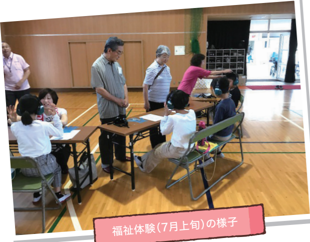
福祉体験(7月上旬)の様子

先日行われた4年生の社会福祉体験学習では、地域のボランティアの方が38名も参加され、参加者数は港区内でもトップクラスだそうです。ふれあいまつりに限らず、地域の方と子どもが顔を合わせる機会が多く、小学校前の「あいさつ通り」の名のとおり、自然と挨拶も増えます。事件に巻き込まれないようにと、知らない人には挨拶しにくい時代ですが、町に顔見知りが多くなると安心ですよ！