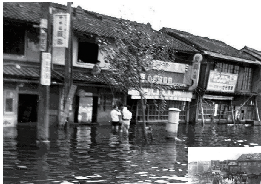
ジェーン台風による浸水(港区)