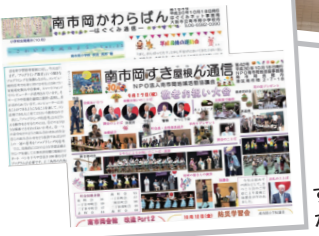
すき屋根通信・かわらばん