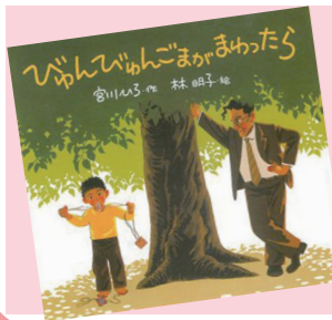
「6~8歳児さんへのお薦めの一冊」

閉鎖されてしまった遊び場の開放を求めて、子どもたちと校長先生との駆け引きが楽しく描かれています。子どもたちの成長に効率を求めずじっくり辛抱強く見守る。親としてたくさん学ぶことがある一冊でした。