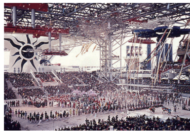
大阪万博・開会式

世界初の万国博覧会（以下万博）は1851年にロンドンで開催され、産業革命で近代化したイギリスの工業技術の世界に知らしめる役割を果たしました。そして今から半世紀前、太陽の塔がそびえ立つ万博記念公園で開催された大阪万博（1970年）。それぞれの文化や伝統、技術を紹介する国や企業のパビリオンに、およそ6400万人が来場したそうです。当時の万博を知る人は、「とにかく人が多かったです」「お目当てのパビリオンは諦めて、人気のないパビリオンくらいしか見れなかった」といった感想が多いようですが、未来のものとして展示された携帯電話やテレビ電話、温水洗浄便座、動く歩道や電気自動車など、現代には実現されたものも数多くあります。1970年当時とは異なり、情報化とグローバル化がすすみ、あらゆる情報が手に入る時代に何をみるものになるのか楽しみですね！