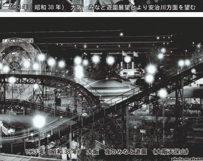
▲みなと遊園