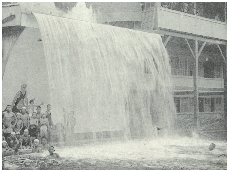
▶築港大潮湯

土日のみならず平日でもたくさんの方で賑わう天保山。海遊館や観覧車、マーケットプレスなど、今でも楽しい施設が盛り沢山ですが、その歴史は古く、明治時代までさかのぼります。 大阪港の開港は1868年。その20年後には「天保山遊園」(1888~1897年)が開園しました。海水を沸かした入浴施設や釣り堀、潮干狩りなど、当時としては珍しいレジャー施設だったようです。その後、「築港大潮湯」(1914~1934年)という海水を使った温泉施設が開業し、プールやレストラン、映画や演芸場もありましたが、1934年の室戸台風で被災し閉鎖されました(磯路にあった市岡パラダイスは1925~1930年)。 また戦後は、地下鉄中央線(大阪港~弁天町間)の開業と同じ年に、「みなと遊園」(1961~1972年)が開園(現在の天保山第五コーポの地)。ジェットコースターやヘリコプター塔、プールや動物園など、大きな遊園地だったようです。平成に入ってから皆さんご存知の海遊館とマーケットプレスが1990年に開業し、時には弁天町付近まで大渋滞を引き起こす程の賑わいを見せます。ちなみに、海遊館という名前が公募されたそうですが、審査員だった上沼恵美子さんが「海遊館」を強く推されたそうです！