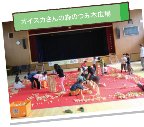
オイスカさんの森のつみ木広場