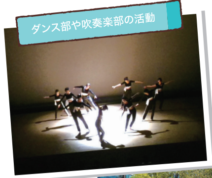
ダンス部や吹奏楽部の活動