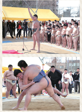
相撲大会みなとふれ