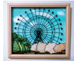
ガラスアート天保山桜