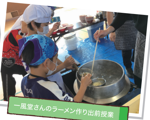
一風堂さんのラーメン作り出前授業