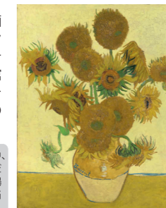
フィンセント・ファン・ゴッホ「ひまわり」 1888年 油彩・カンヴァス 92.1×73cm ©The National Gallery, London. Bought, Courtauld Fund, 1924

英国が誇る世界屈指の美の殿堂、ロンドン・ナショナル・ギャラリー。ヨーロッパ絵画を網羅する質の高いコレクションで知られる同館が、その200年の歴史で初めて、館外で大規模な所蔵作品展を開催。歴史的な展覧会をこの機会に是非ご鑑賞ください。