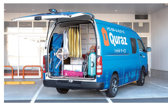
ご自宅まで無料でお迎え! 1人1回の利用。お迎えエリアはお問合せください。

「車がないので荷物が運べない」「使ってみたくて配送業者の手配までは...」そんな人に朗報!キュラーズの無料シャトルサービスは、シャトル便が自宅からキュラーズの店舗までユーザーと荷物を運んでくれます(荷物の積み下ろしはユーザー自身で)。シャトル便は1日3枠(要予約)、4人まで同乗できます。業界初のこのサービス、「見学したいけど店舗まで行くのが面倒」という人にもお勧め。withコロナのお片付けにベストマッチなキュラーズのトランクルーム、この機会に体験してみませんか?