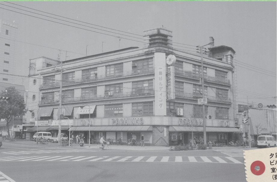
夕風交差点にあった一岡ビルディング。みなとQ編集室の出発点でした。